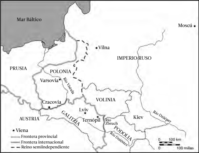
Mapa 1: Partición de Polonia y Galitzia después de 1815.