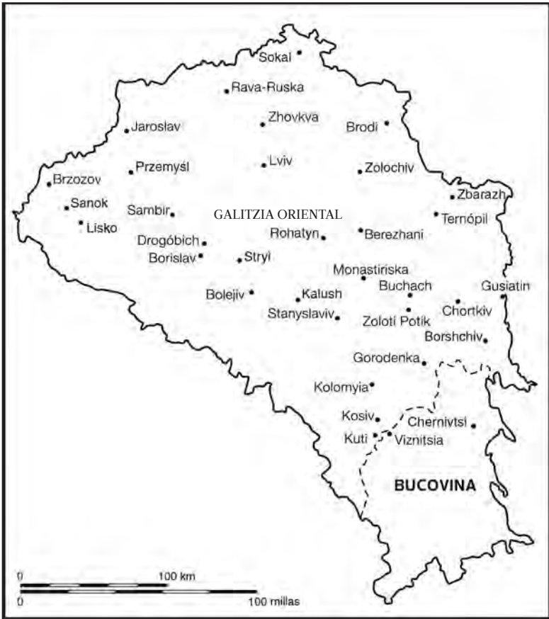
Mapa 2: Los distritos de Galitzia Oriental y Bucovina en 1910.