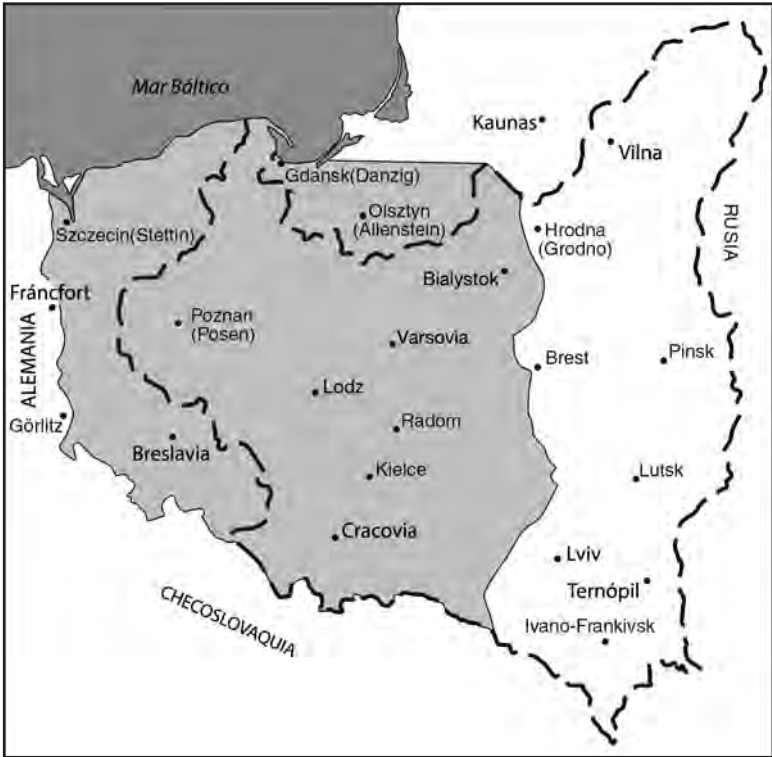
Mapa 5: La Polonia independiente en los periodos de entreguerras y posguerra.