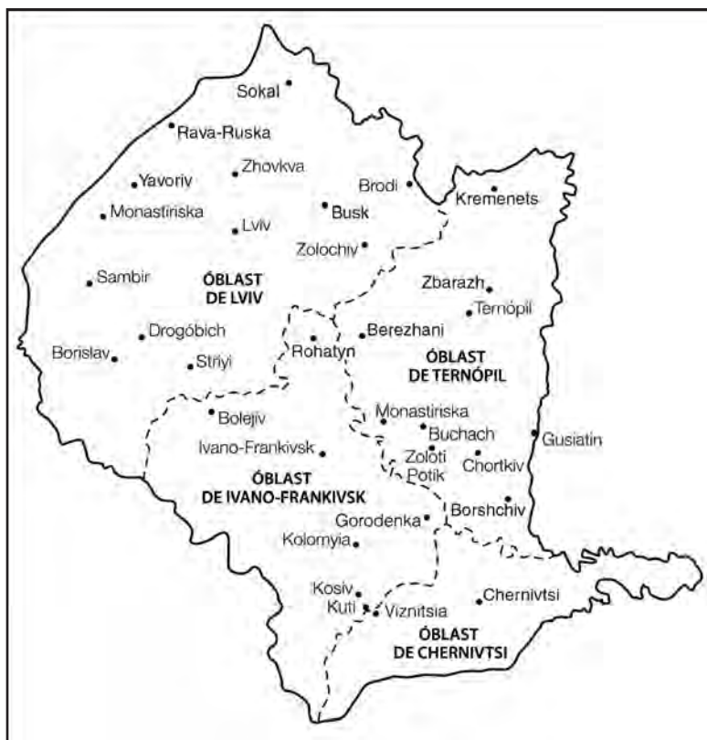
Mapa 4: Óblasts (provincias) y raiones (comarcas) de las antiguas Galitzia Oriental y Bucovina en la Ucrania soviética (1972).