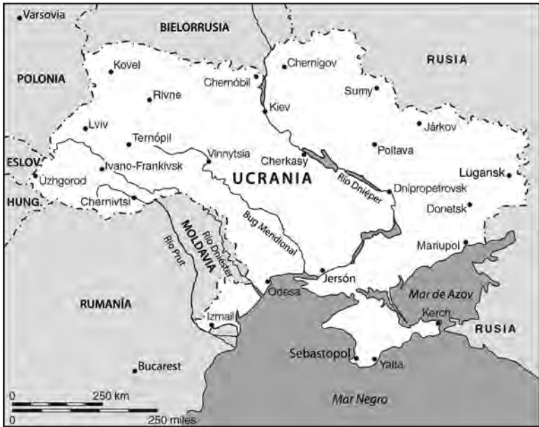
Mapa 6: La Ucrania independiente.